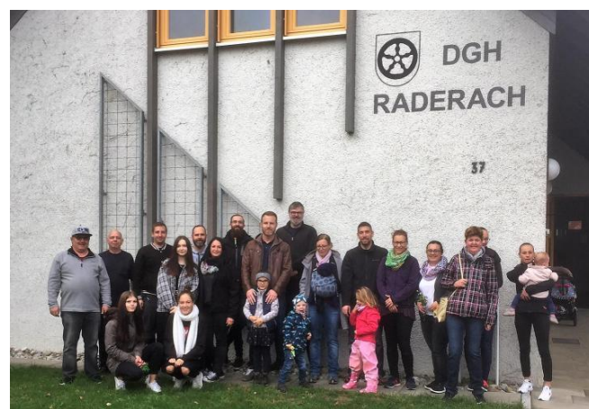
Teilnehmer der Waldputzede 2018

Ausweichtermin bei schlechtem Wetter ist der 19.10.2018